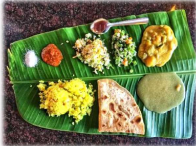
ヨガアシュラムでは、穀物・野菜中心の食事。バナナの葉をお皿代わりに。

ヨガにもいろんな流派がありますが、シヴァナンダヨガは、インドの Swami Sivananda (スワミ・シヴァナンダ) (1887-1963) という方が確立したやり方です。医師として活動をしていたシヴァナンダ師は、